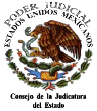
CUADRO COMPARATIVO: PROYECTO DE PRESUPUESTO 2020 Vs. PRESUPUESTO INICIAL AUTORIZADO Y PRESUPUESTO AUTORIZADO MODIFICADO 2019