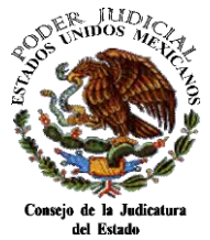
CUADRO COMPARATIVO: PROYECTO DE PRESUPUESTO 2018 Vs. PRESUPUESTO INICIAL AUTORIZADO Y PRESUPUESTO AUTORIZADO MODIFICADO 2017